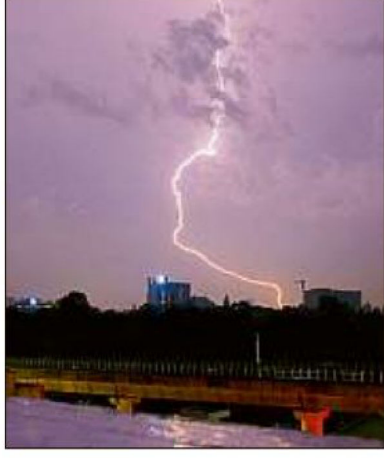
ವರದಿಯ ಪ್ರಕಾರ, ನಗರದಲ್ಲಿ ವಾರ್ಷಿಕ ಗುಡುಗು ಸಹಿತ ಮಳೆ ಶೇ 3.41ರಷ್ಟು ಮತ್ತು

ಬೆಂಗಳೂರು: ನಗರದಲ್ಲಿ ವರ್ಷದ ವರ್ಷಕ್ಕೆ ಗುಡುಗು-ಮಿಂಚು ಮತ್ತು ಆಲಿಕಲ್ಲು ಮಳೆಯ ಪ್ರಮಾಣವು ಗಣನೀಯವಾಗಿ ಹೆಚ್ಚಳವಾಗುತ್ತಿದೆ ಎನ್ನುವುದು ಹವಾಮಾನ ಇಲಾಖೆ ನಡೆಸಿದ ಅಧ್ಯಯನದಿಂದ ದೃಢಪಟ್ಟಿದೆ.